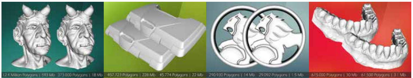
ビデオゲーム・エンターテインメント